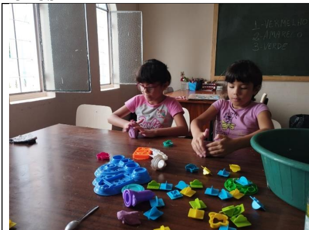
Confecção de massinha