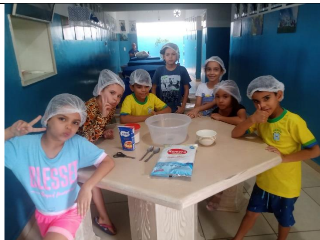
Culinaria – Beijinho