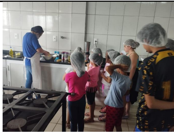
Culinária – Pão caseiro