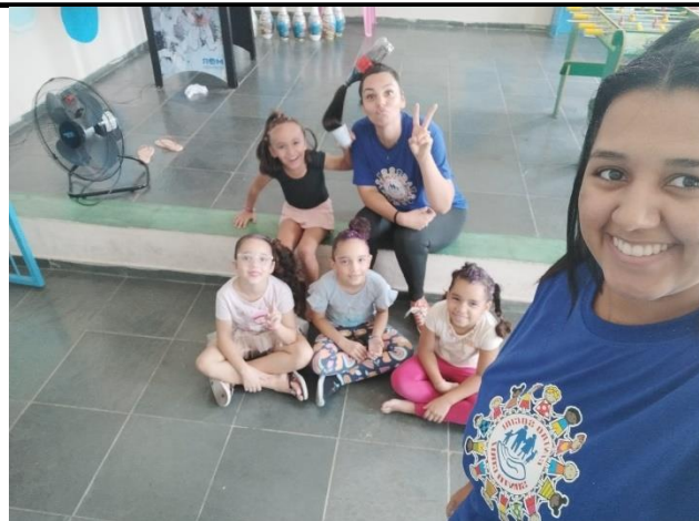
Dia do cabelo maluco