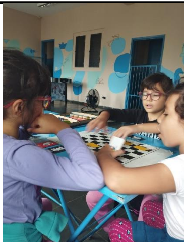
Jogo da velha

Site: centrossc.com.br - E-mail: cssantacruz@terra.com.br