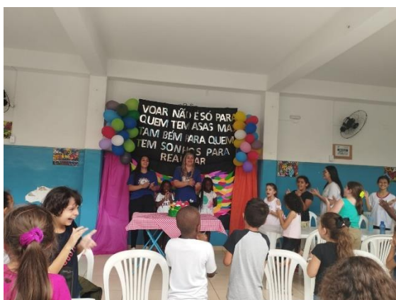
Turma da Tarde- Festa aniversariantes de Janeiro