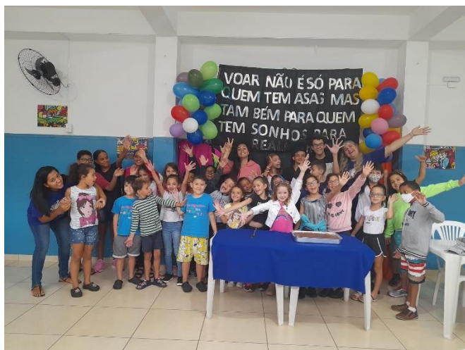
Turma Manhã – Festa aniversariantes do mês de Janeiro