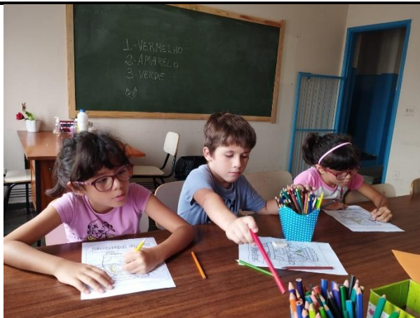
Confecção de quebra cabeça

Site: centrossc.com.br - E-mail: cssantacruz@terra.com.br