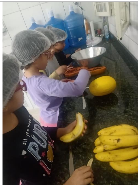
Culinaria salada de fruta