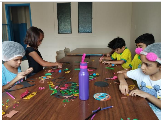
Confecção de peão