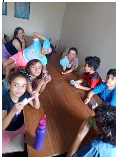
Confecção de slime